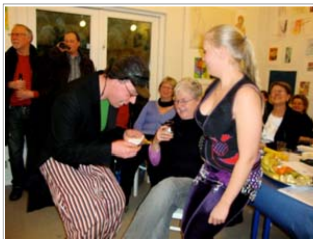
De Splittergale siger tak