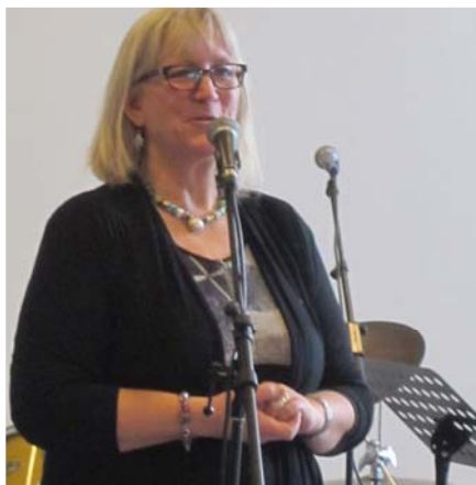
Mie holder tale